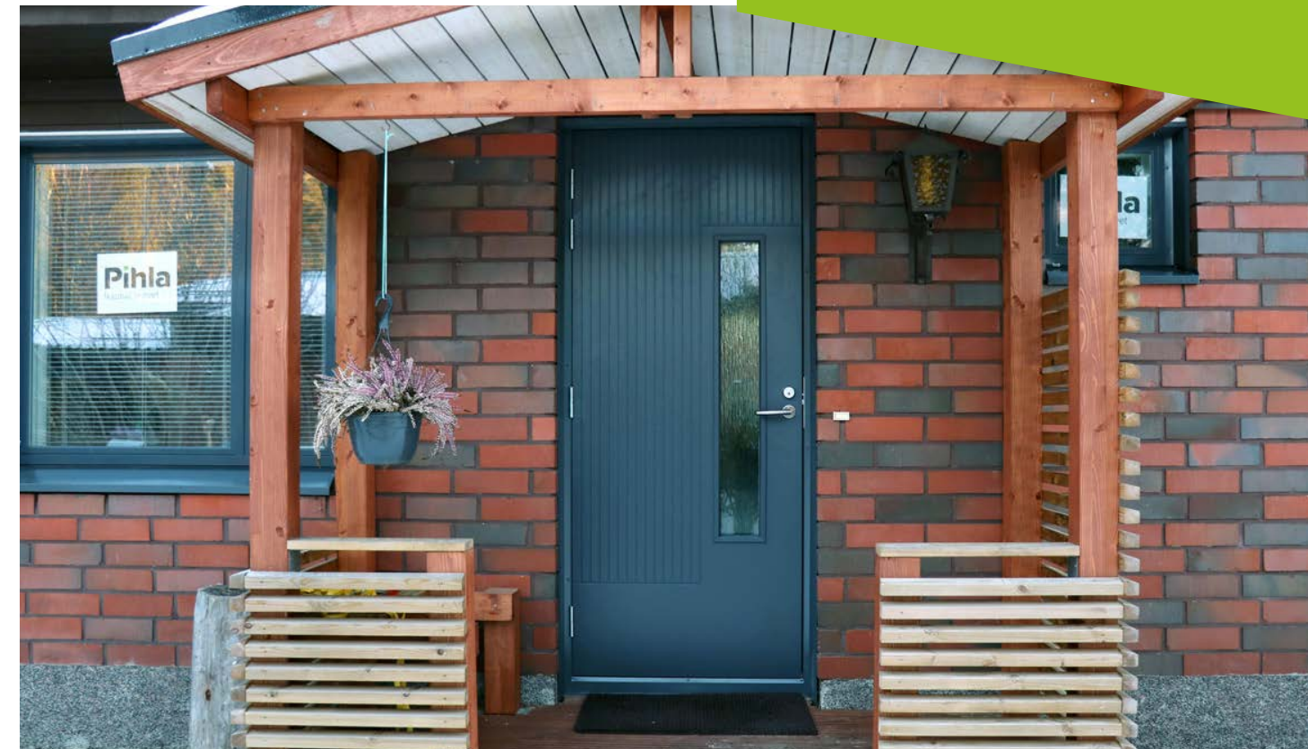
: Remontin jälkeen talo sai ryhdikkäämmän ilmeen.