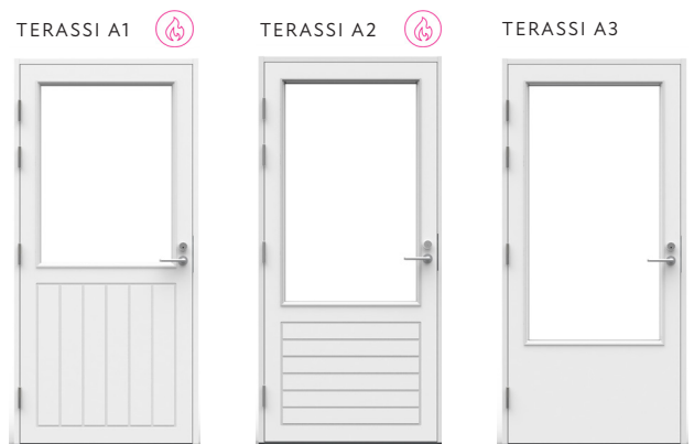
Tiivi Terassi A1-malli M12-lasilla, A2-malli M14-lasilla ja A3-malli M16-lasilla. Lasiaukon korkeuden voi myös määrittellä vapaasti.