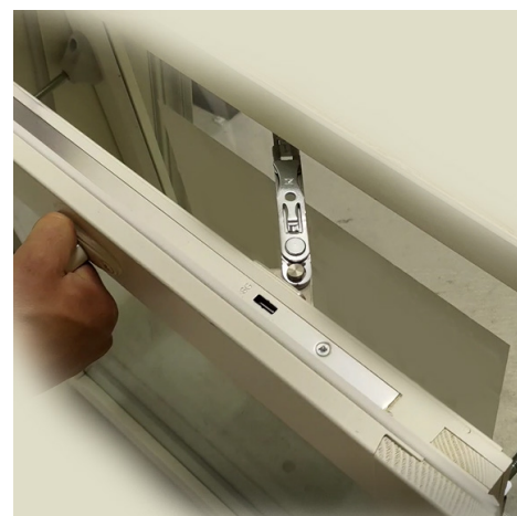
Kuva 1. AVR-lisärajoitin.

Ikkunan puitteiden on aina oltava kytkettynä toisiinsa, eli aukipitolaitteiden tukipultit painettuna liukukiskoon. Tuuletettaessa ikkunan puitetta avataan niin paljon, että aukipitolaitteen kytkentähahlo tarttuu tuulihaakaan. Jos puitteet irrotetaan toisistaan pesun ajaksi, on varmistettava, että aukipitolaitteet ja lisärajoittimet kytketään loppuksi takaisin paikalleen, ks. Kuva 3.