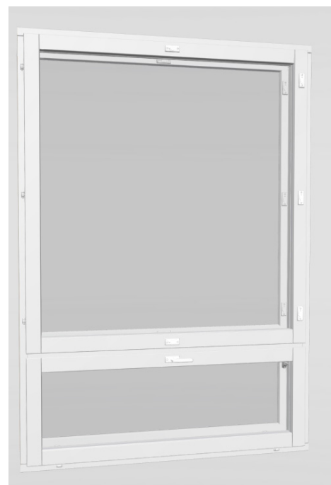
Kuva 2. Tyypillinen avattava ikkuna, jossa alasaranoitu tuuletusikkuna. AVR-lisärajoitin ei näy ulospäin.