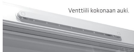
Venttiili kokonaan auki.

Suodattimien tilaus. Uusia suodattimia saa kätevästi Pihlan verkkokaupasta: verkkokauppa.pihla.fi