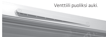
Venttiili puoliksi auki.