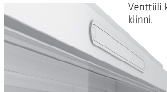
Venttiili kokonaan kiinni.