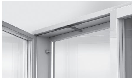
Suodattimen vaihto avattavassa ikkunassa.

Suodatin vaihdetaan avaamalla ikkunan puite ja poistamalla suodatin yläkarmista. Ilmakanavat sekä puitteen yläpuolelta että yläkarmista (venttiilin yläpuolella) voidaan imuroida, kun suodatin on poistettu.